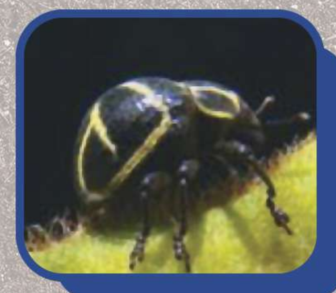
Picudo ( Sternechus subsignatus )