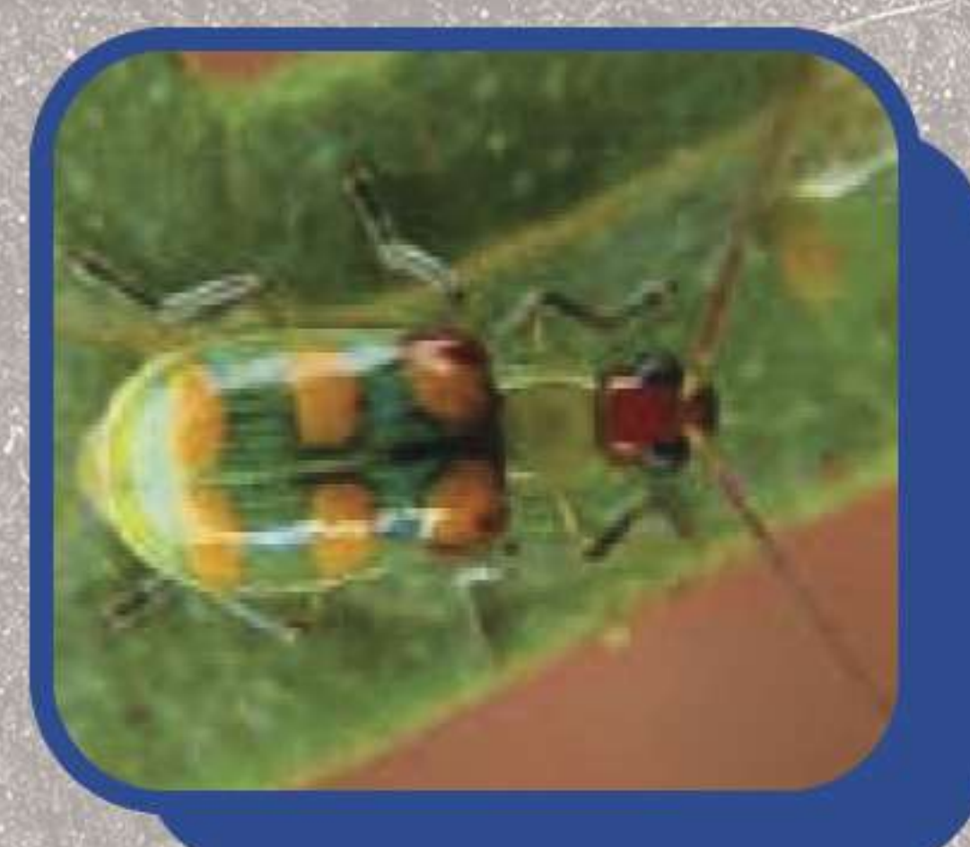
Petilla ( Diabrotica speciosa )