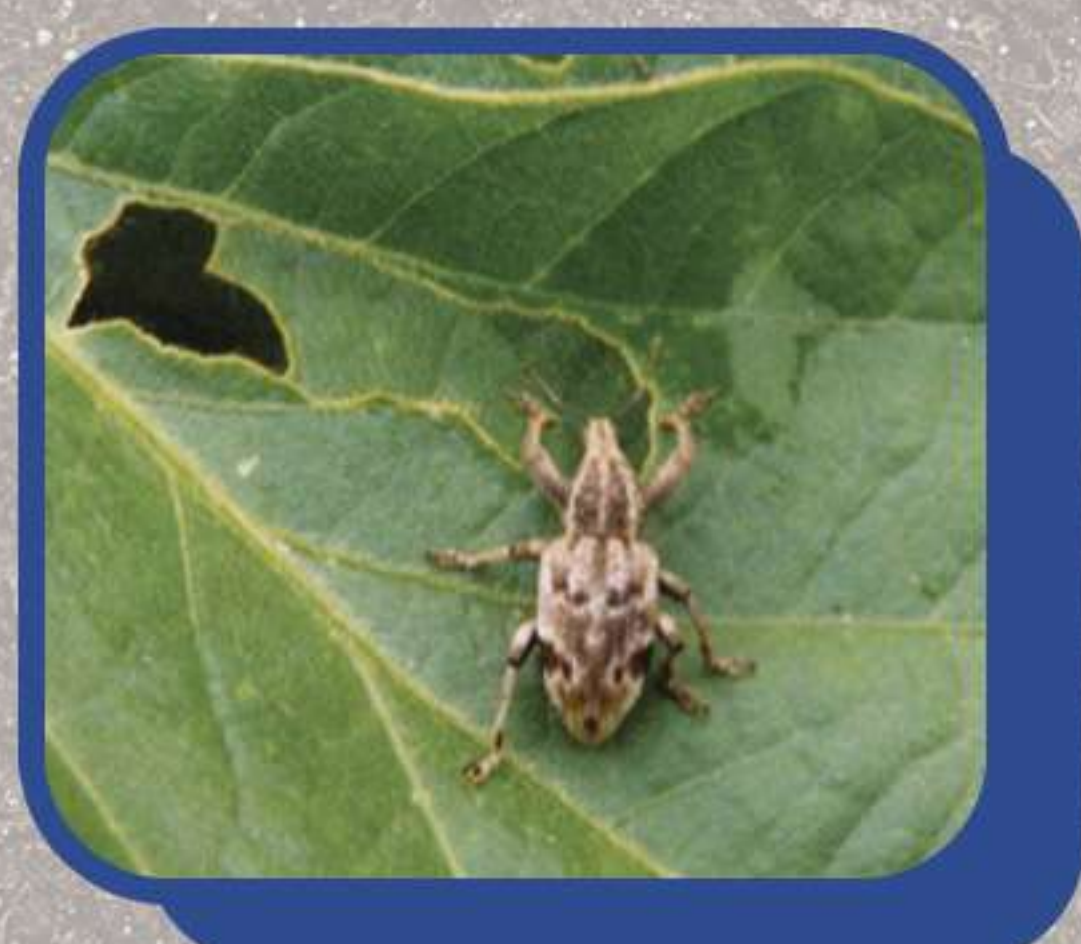
Picuditos ( Hypsonotus sp Promecops sp )