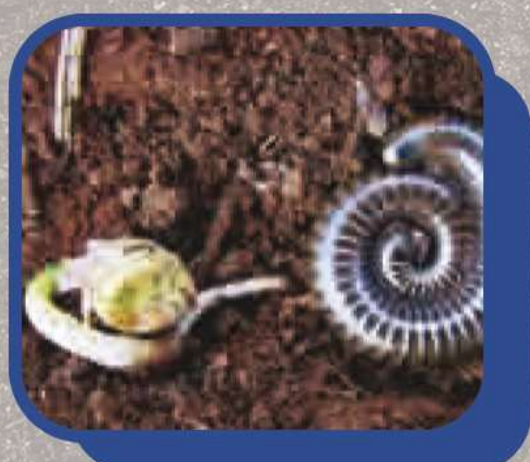
Quema Quema ( Julus sp )