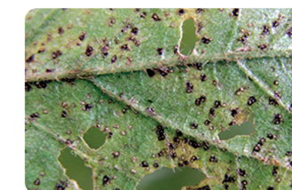
ROYA ASIÁTICA ( Phakopsora pachyryzii )

Versatilis Por su Nuevo y Único modo de acción en el cultivo de la soja, permite un control efectivo de Roya .