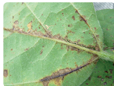
Antracnosis ( Colletotrichum spp )