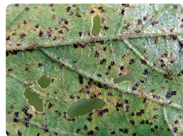
Roya asiática ( Phakopsora pachyryzii )

Además de las principales enfermedades que afectan al cultivo de soja en sus diferentes etapas: