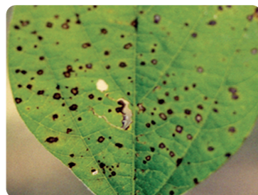
Mancha ojo de rana ( Cercospora sojae )