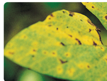
Mancha marrón ( Septoria glycines )