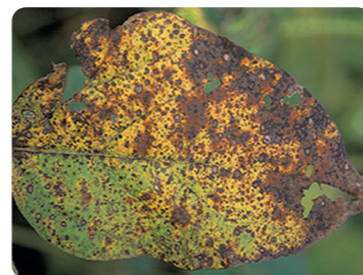
Cercospora ( Cercospora kikuchii )