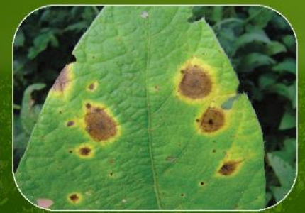
Mancha Anillada ( Corynespora cassicola )

Además de las principales enfermedades que afectan al cultivo de soja en sus diferentes etapas: