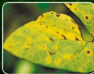
Mancha marrón ( Septoria glycines )