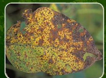
Cercospora ( Cercospora kikuchii )