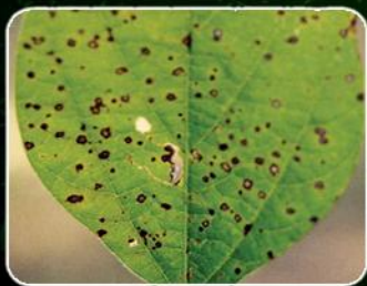
Mancha ojo de rana ( Cercospora sojina )

Además de las principales enfermedades que afectan al cultivo de soja en sus diferentes etapas: