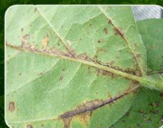
Antracnosis ( Colletotrichum spp )