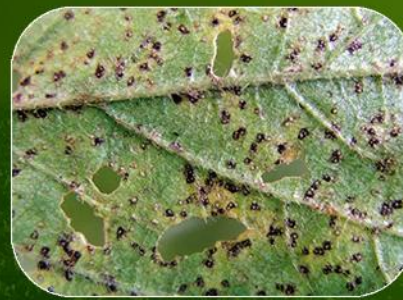
Roya Asiática ( Phakopsora pachyryzii )

Permite un control efectivo de: LA ROYA ASIÁTICA, MANCHA ANILLADA Y EFC