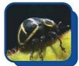
Picudo ( Sternechus subsignatus )