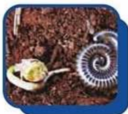
Quema Quema ( Julus sp )