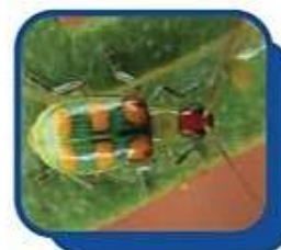
Petilla ( Diabrotica speciosa )