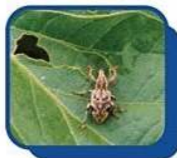
Picuditos ( Hypsonotus sp Promecops sp )